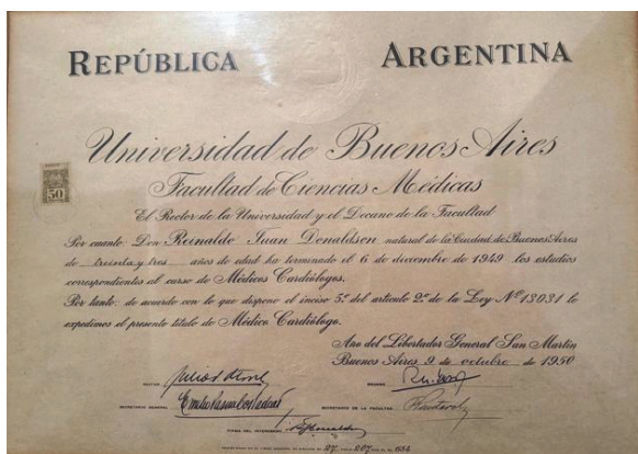
Figura 3. Diploma Médico Cardiólogo.