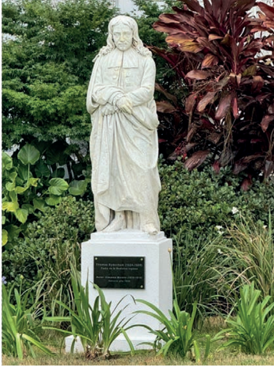
Figura 5. Estatua Thomas Sydenham.