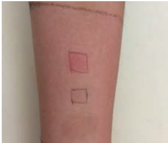
Figura 3. Lectura tercer patch test a las 48 horas en antebrazo izquierdo, resultado positivo a mezcla de parabenos.

bellón auricular izquierdo y eritema en mejilla y zona laterocervical izquierdas. Se inició manejo antibiótico con amoxicilina + ácido clavulánico vía oral, sin mejoría posterior a tres días, por lo cual se internó para manejo endovenoso con impresión diagnóstica de celulitis.