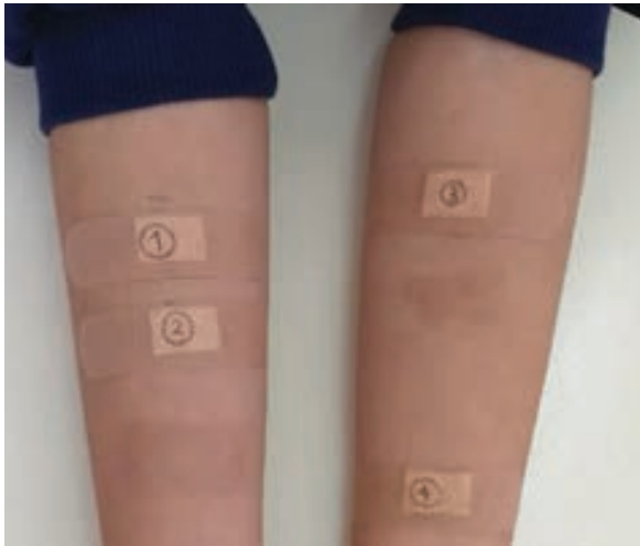
Figura 1. Segundo patch test en antebrazos (1. Trimetropin sulfametoxazol, 2. Gentamicina, 3. Hidrocortisona y 4. Lidocaína).