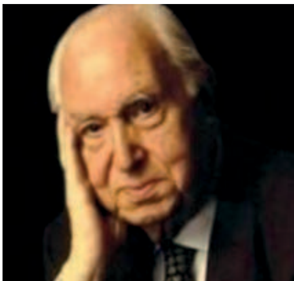
Figura 1. Pedro Laín Entralgo 1 .