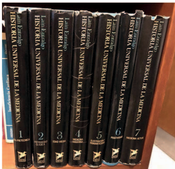
Figura 2. Historia Universal de la Medicina (Biblioteca personal).

Sus méritos intelectuales lo llevaron a ser designado miembro numerario de la Real Academia de Medicina, en mayo de 1946. Además, fue incorporado a la Real Academia de la Lengua, en 1954, y a la Real Academia de la Historia, en 1962. Presidió la Academia de la Lengua entre 1982 y 1987 en reemplazo de Dámaso Alonso. Fue nombrado Doctor Honoris Causa de las Universidades de San Marco de Lima, Toulouse de Francia, Zaragoza y Valencia de España. Perteneció, asimismo, a la Akademie der Wissenschaften von Heidelberg , la Academia Leopoldina de Halle, Académie Internationale d'Histoire des Sciences , de la Hispania Society of America y la Royal Society de Londres 5 . En 1975 fue galardonado con el Premio Montaigne de periodismo, en reconocimiento a su labor como médico y ensayista; en 1978, le fue otorgada la Gran Cruz de la Orden Civil de Alfonso X el Sabio; en 1980, la Gran Cruz de la Orden Civil de Sanidad y el Premio Aznar otorgado por la agencia Efé; en 1989, el Premio Príncipe de Asturias de Humanidades; en 1991, el V Premio Internacional Menéndez Pelayo por su obra científica y literaria, sus trabajos acerca de la historia de la medicina y su estudio sobre el humanista que da el nombre al galardón; y, en 1999, el Premio Internacional de Ensayo Jovellanos por su obra ¿Qué es el hombre? , evolución y sentido de la vida. También incursionó en la dramaturgia, recibiendo el Premio Nacional de