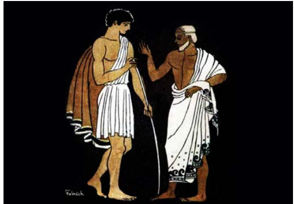
Figura 5. Mentor junto a Telémaco. En: https://es.wikipedia.org/wiki/M%C3%A9ntor_(mitolog%C3%ADa) (consultado 25/12/17).

El nombre de este personaje ha pasado a las lenguas románicas para designar al consejero sabio y experimen-