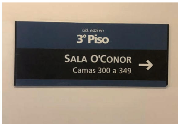
Figura 7. Cartel indicador de ingreso.