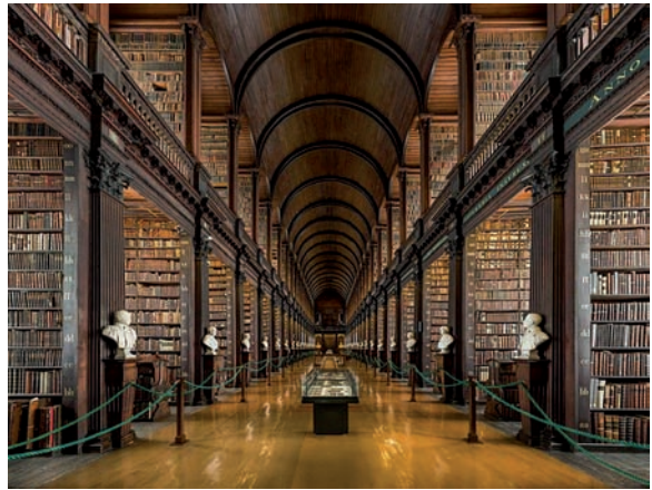
Figura 3. Biblioteca del Trinity College de Dublin. https://en.wikipedia.org/wiki/File:Long_Room_Interior,_Trinity_College_Dublin,_Ireland_-_Diliff.jpg (Consultado 27/12/2017).

donde recibía con generosidad a sus amigos. Ahí se sentía más a gusto que en el Club Inglés y que en el Club de Extranjeros. Era un hombre caritativo, amante de la música y un estudioso de la Historia. Lo recordaban como un buen relator de anécdotas.