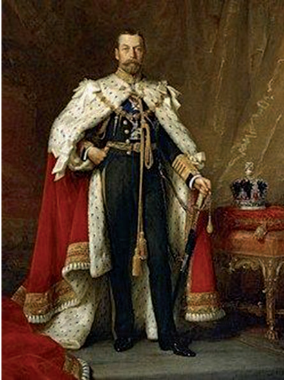
Figura 4. Rey Jorge V de Inglaterra. En: https://es.wikipedia.org/wiki/Jorge_V_del_Reino_Unido . (Consultado 22/10/17).

tido común de sus escritos. Un párrafo interesante de O'Connor en el prólogo es el siguiente: “Operar lentamente no es razonable, sobre todo en la cirugía abdominal, ya que además de favorecer el colapso masivo del pulmón, tiende a producir ‘shock’; favorece el envenenamiento de la sangre por la anestesia; favorece la aparición de septicemia, sin mencionar esa peligrosa complicación, la charla, con su consecuente atomización de saliva que contamina el lugar operatorio.” Varios autores han comentado que sus operaciones se realizaban en absoluto silencio, siendo una penetrante mirada suya suficiente para callar al que violaba esta norma. Marcaba el tiempo de sus operaciones con un cronometrista 4 .