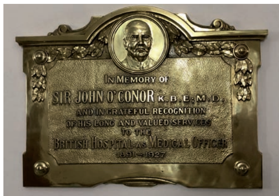
Figura 8. Plaqueta conmemorativa en la misma Sala O'Conor.

tes en sus posoperatorios como de los pacientes clínicos bajo su cuidado. También el Dr. van Rooyen hizo mención a la convicción del Dr. O'Conor acerca de las virtudes del aire fresco, por lo que sus pacientes crónicos eran expuestos en Salas semiabiertas a la temperatura ambiente, así como creía en las bondades del alcohol para esos pacientes crónicos, para los cuales se les servía en el almuerzo un cóctel de huevo con vino Oporto, y cerveza malteada a la noche en la cena 6 .