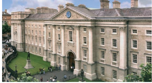
Figura 2. Trinity College de Dublin. https://www.agoda.com/es-es/trinity-college-campus-accommodation/hotel/dublin-ie.html?cid=94 (Consultado 27/12/2017).

Tenía una personalidad encantadora, era locuaz e ingenioso, y gozaba de un amplio círculo de amigos, muchos de ellos argentinos. Era miembro del Jockey Club,