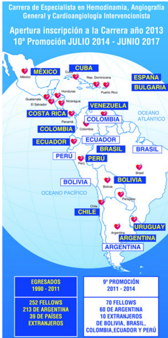
Figura 2. Egresados de la Carrera de Especialista en Hemodinamia, Angiografía General y Cardioangiología Intervencionista 6 .

sinergia entre la UBA y el CACI. La Facultad de Medicina brinda el marco académico apropiado, la continuidad de los planes de estudio, un título universitario con validez nacional e internacional, y el CACI aporta el conocimiento y experiencia de destacados especialistas.